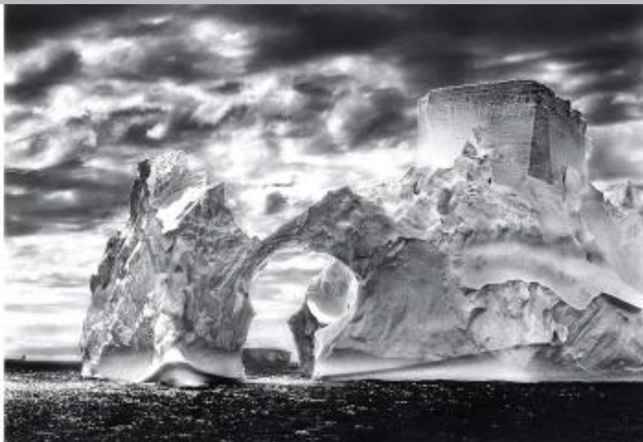
IMMAGINE VU 25