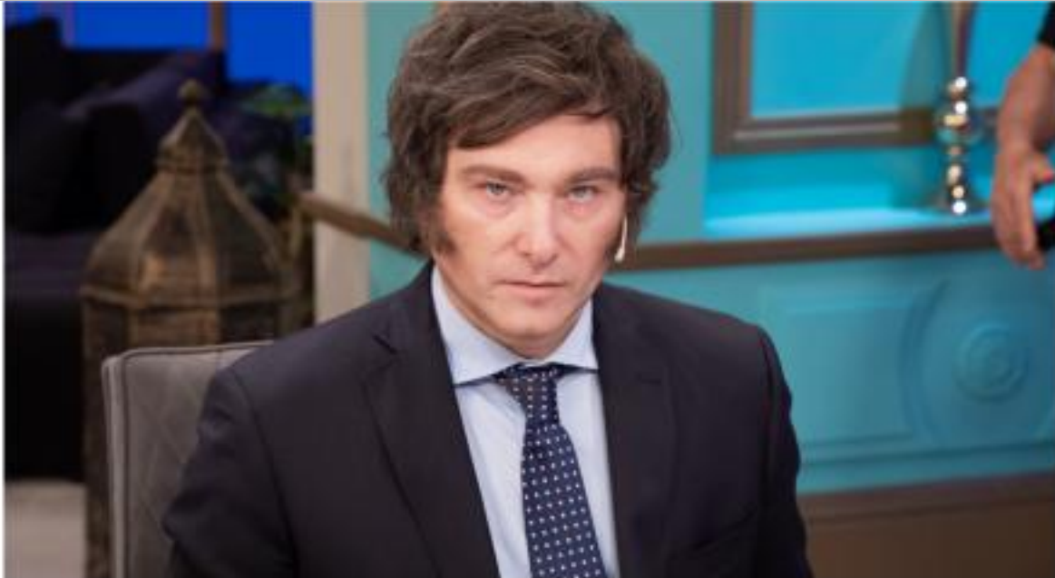
IMMAGINE VU 12