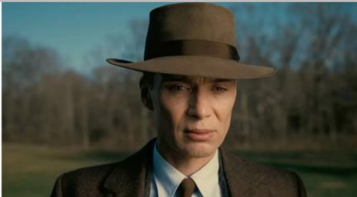
IMMAGINE VU 17