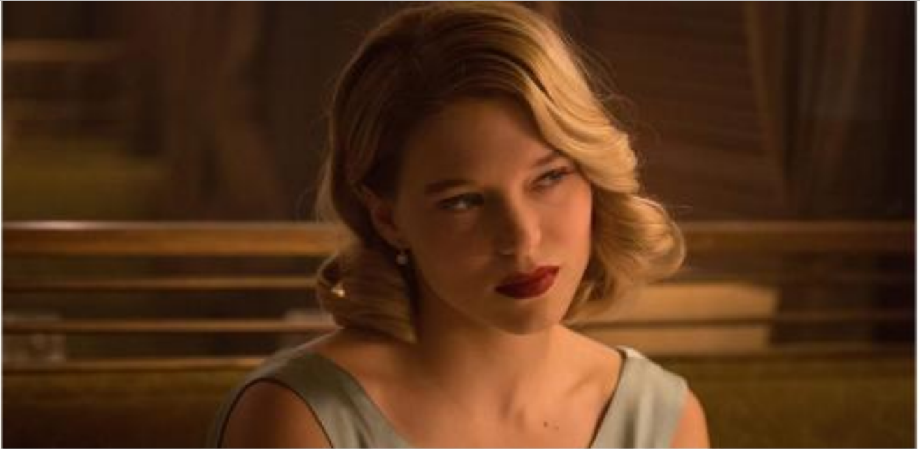
IMMAGINE VU 24