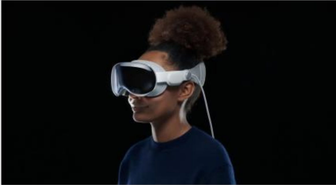
IMMAGINE VU 18