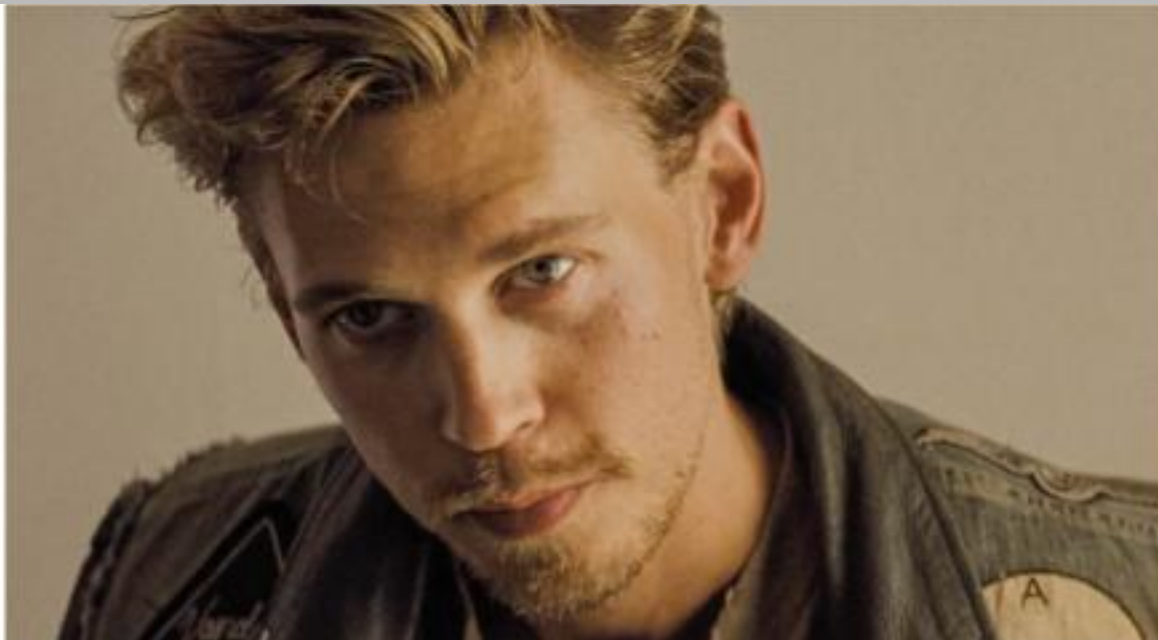
IMMAGINE VU 14