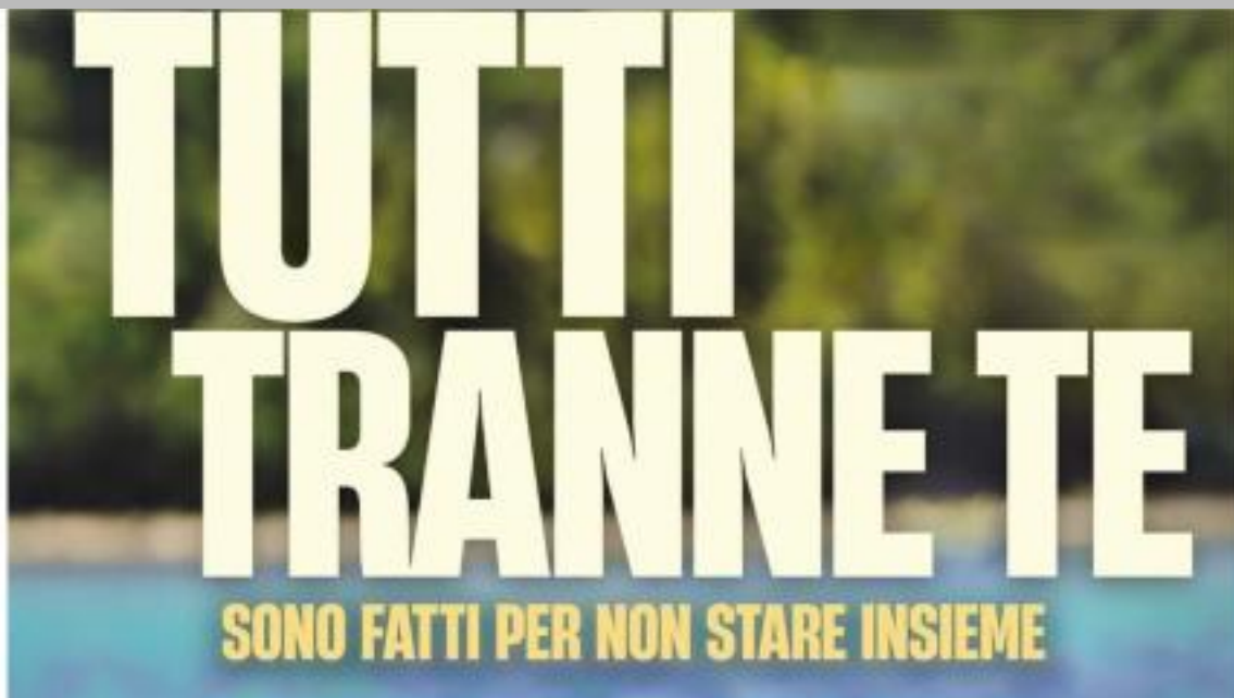
IMMAGINE VU 11