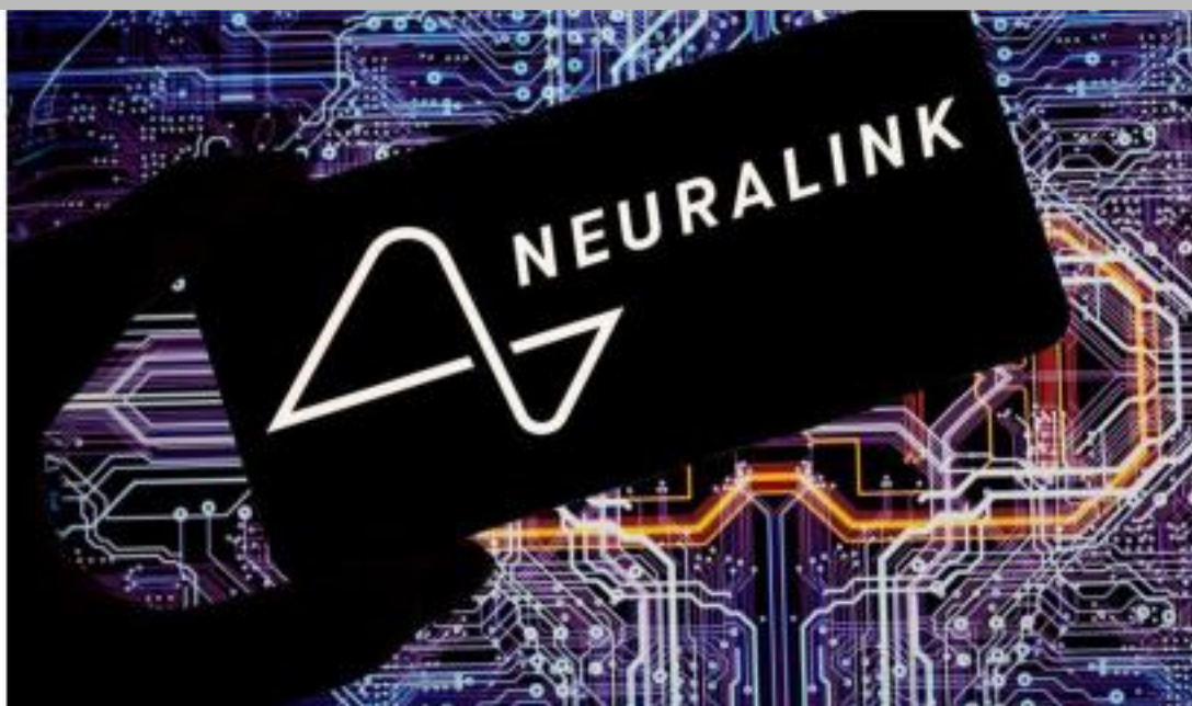
IMMAGINE VU 15