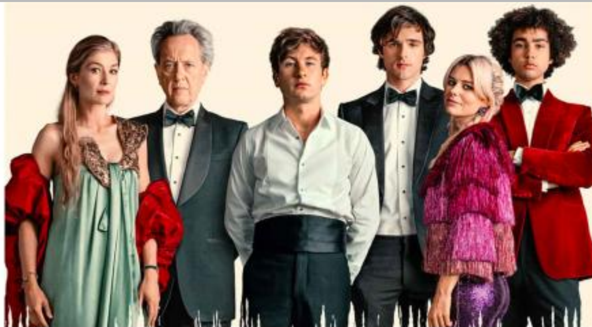
IMMAGINE VU 22