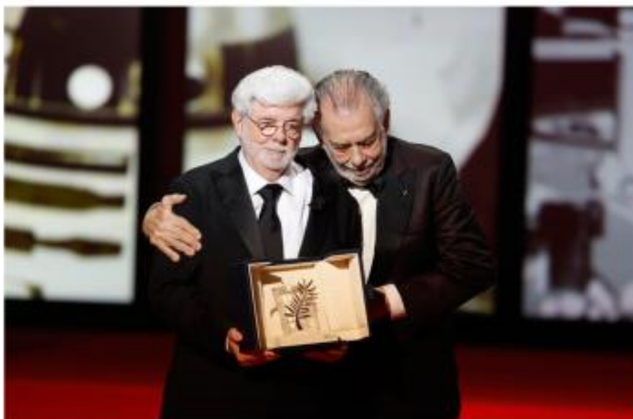
IMMAGINE VU 27