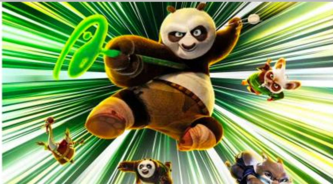
IMMAGINE VU 28