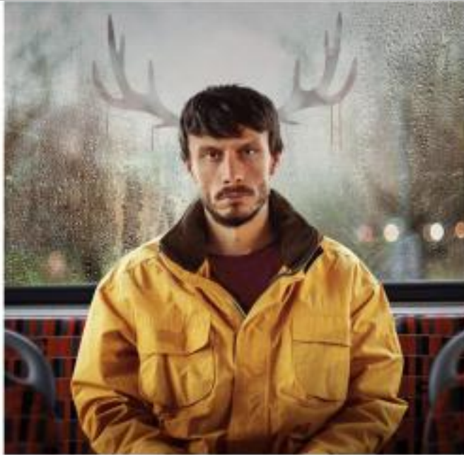
IMMAGINE VU 13