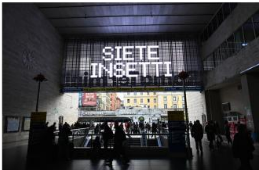
IMMAGINE VU 23