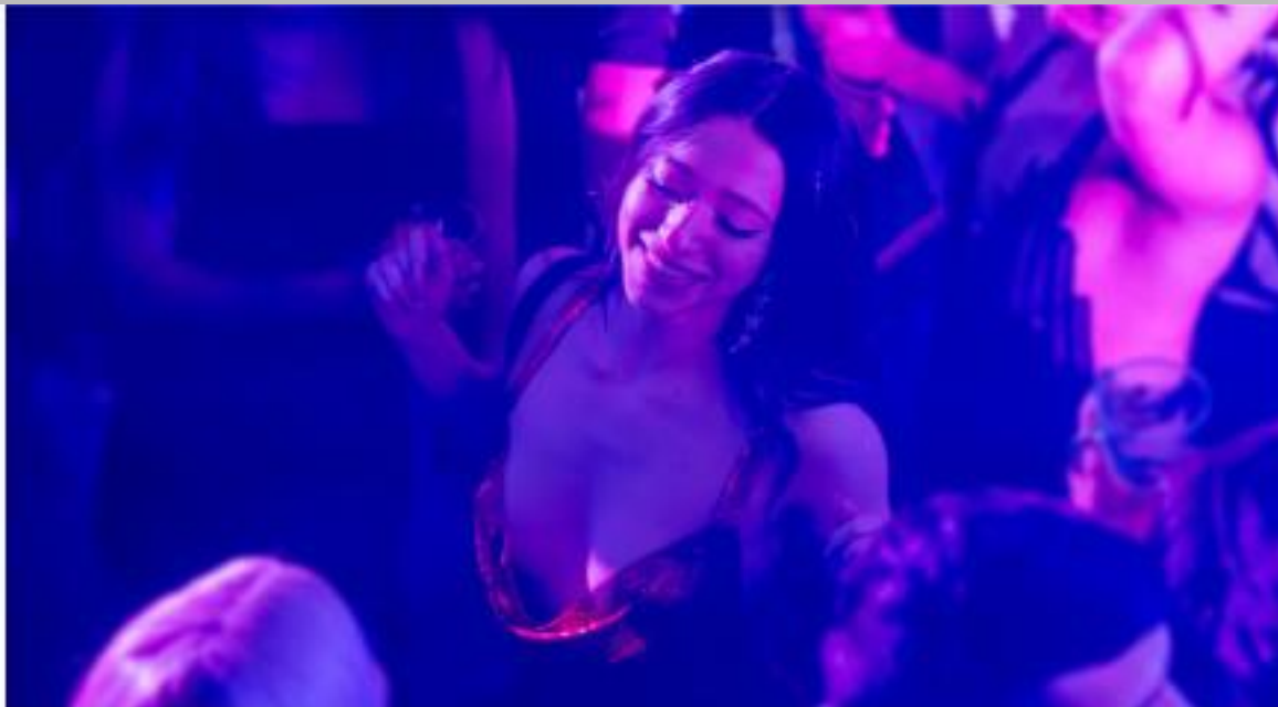
IMMAGINE VU 10