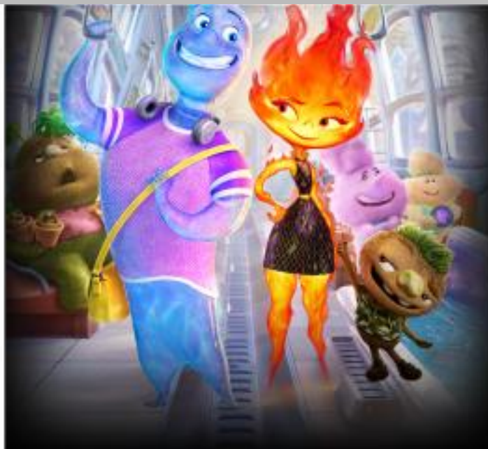
IMMAGINE VU 19