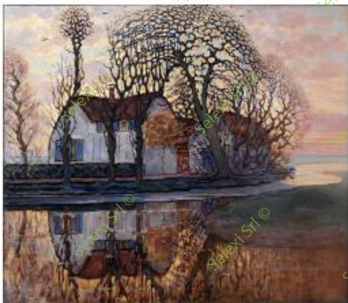
IMMAGINE VS 49