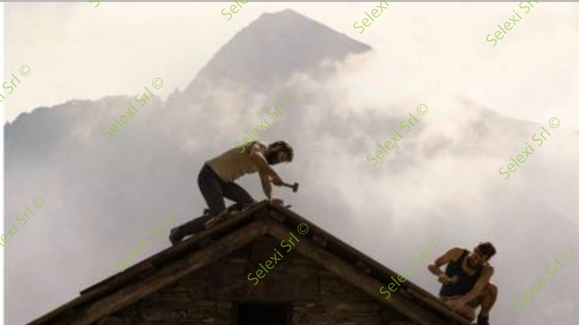
IMMAGINE VS 40