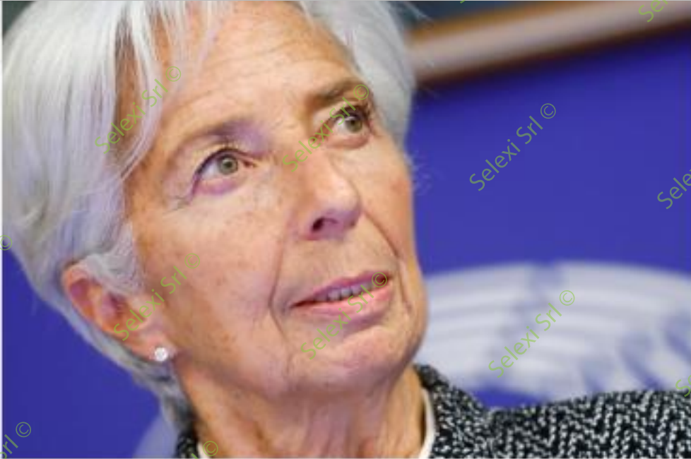
IMMAGINE VS 35

4 Rispondere al seguente quesito facendo riferimento all'IMMAGINE VS 35