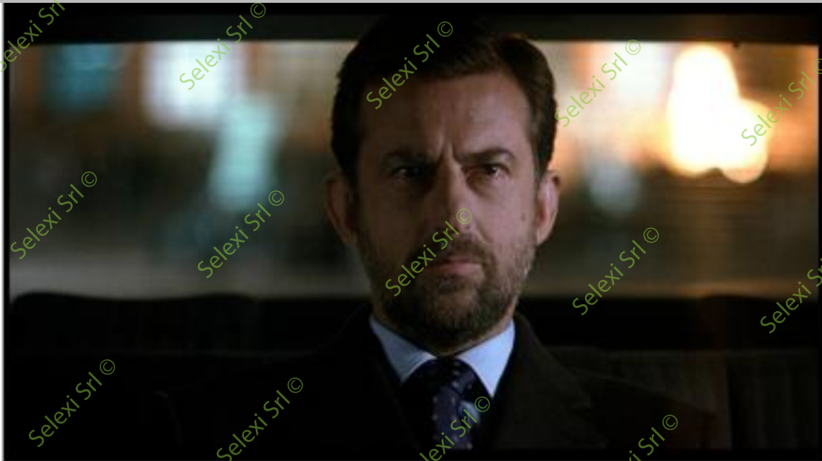
IMMAGINE VS 36