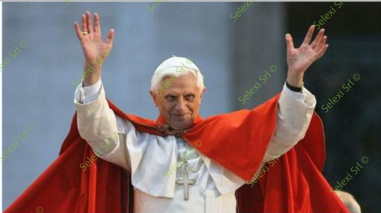
IMMAGINE VS 33