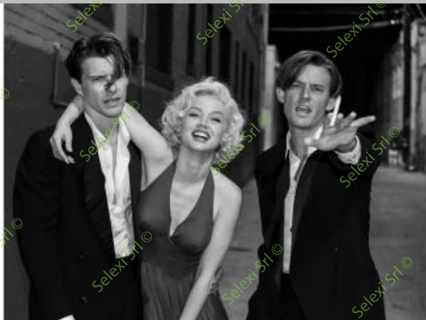
IMMAGINE VS 38