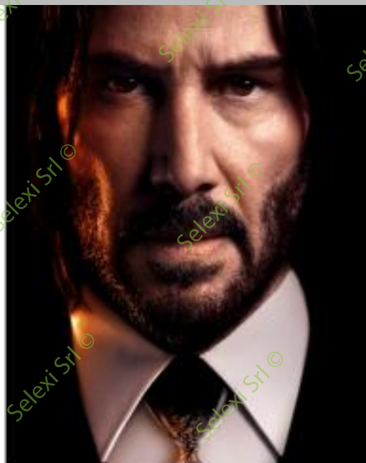
IMMAGINE VS 43