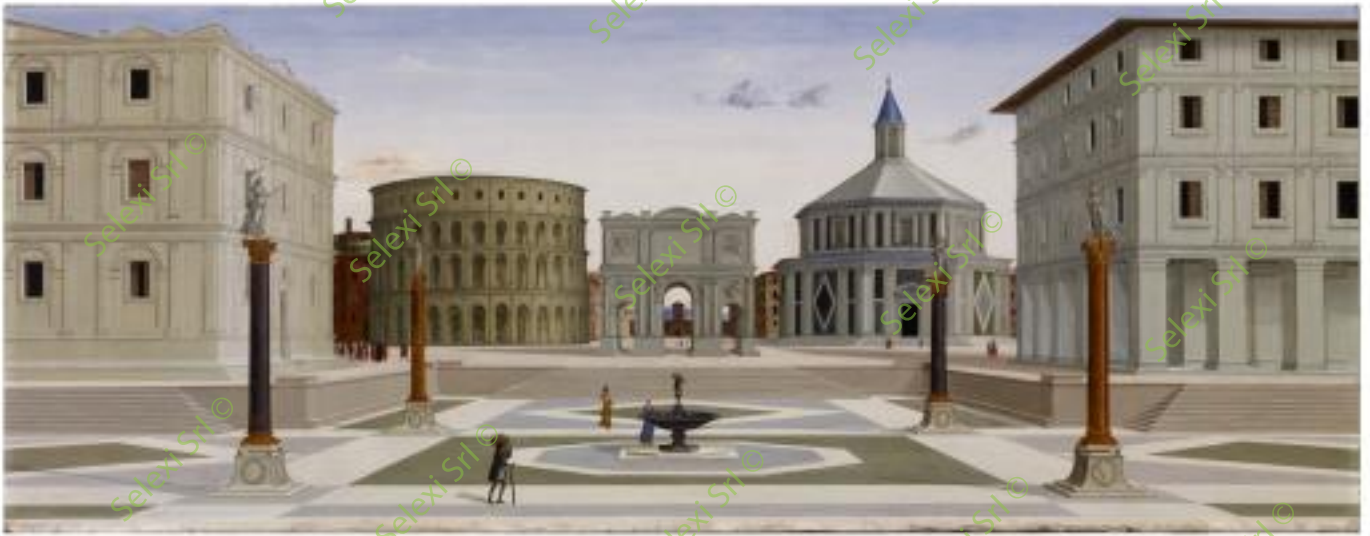
IMMAGINE VS 47