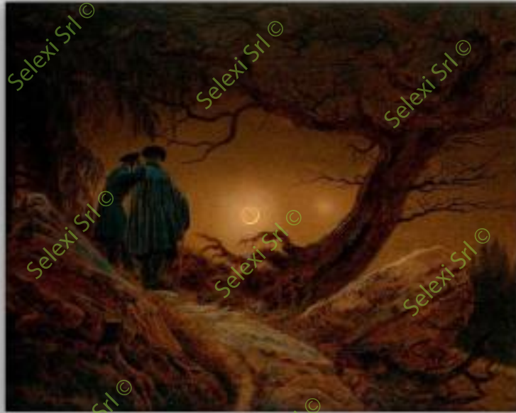
IMMAGINE VS 50