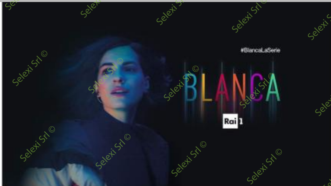
IMMAGINE VS 41