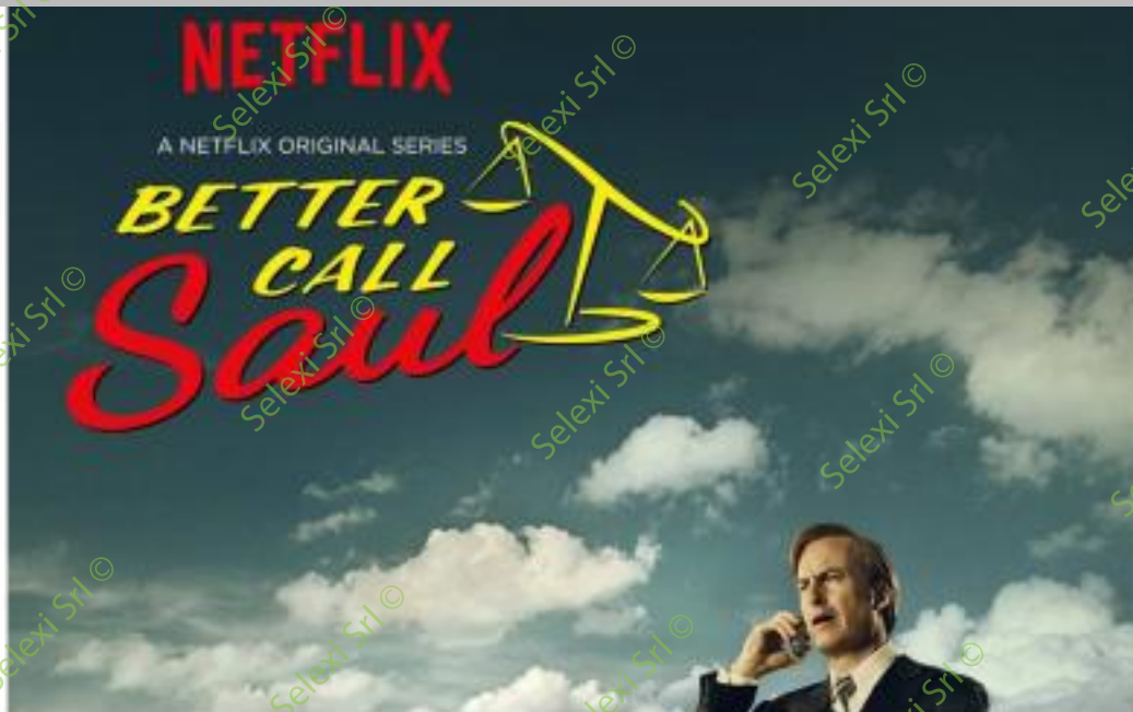
IMMAGINE VS 44