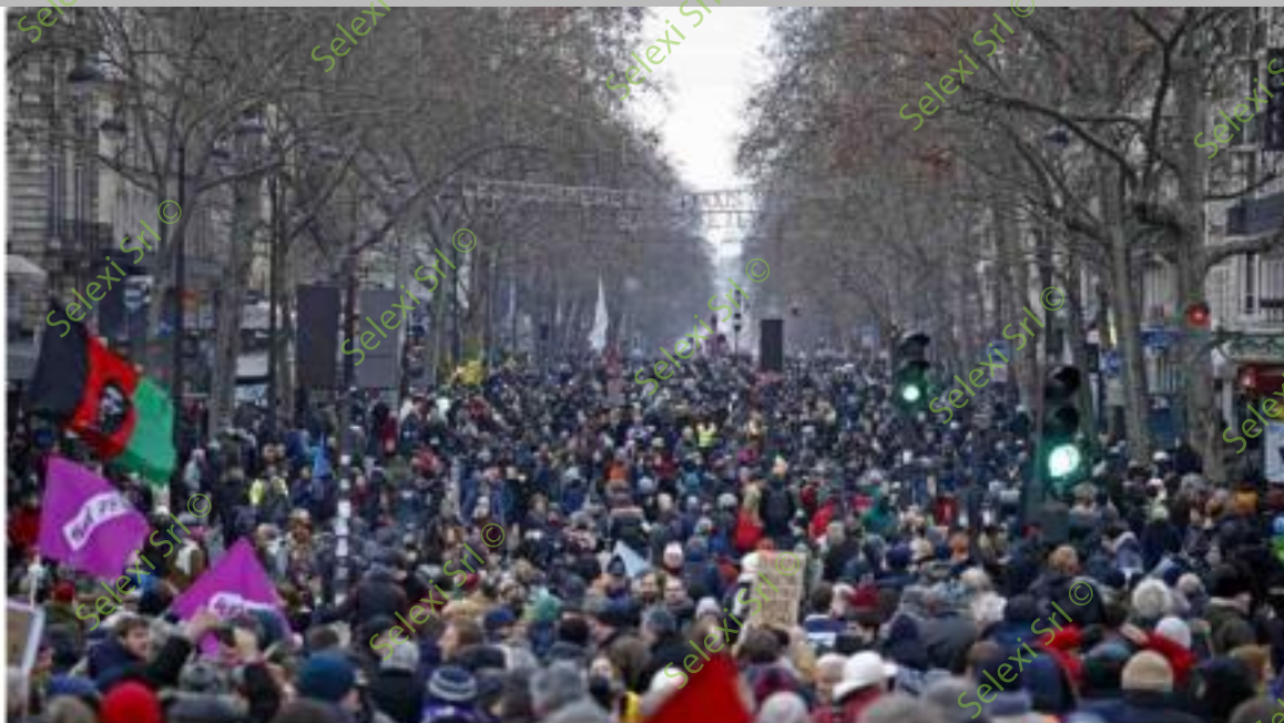
IMMAGINE VS 34