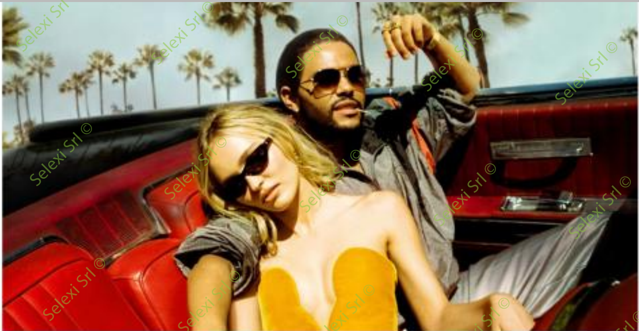
IMMAGINE VS 39