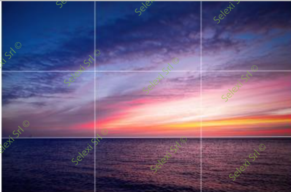
IMMAGINE VZ 34