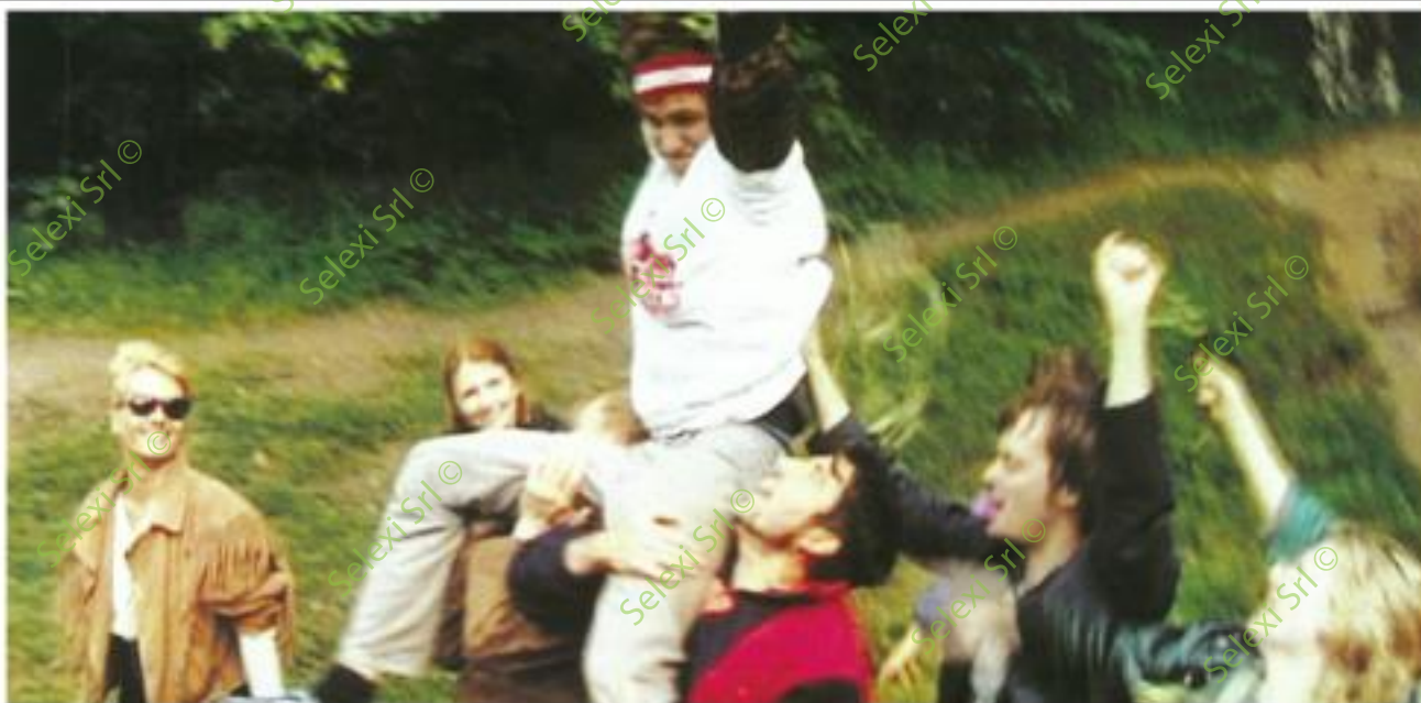
IMMAGINE VS 48