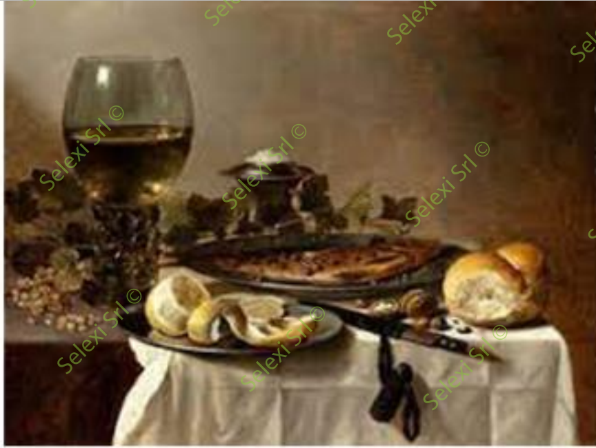
IMMAGINE VZ 31