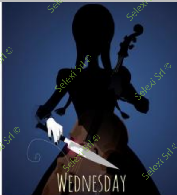
IMMAGINE VS 37