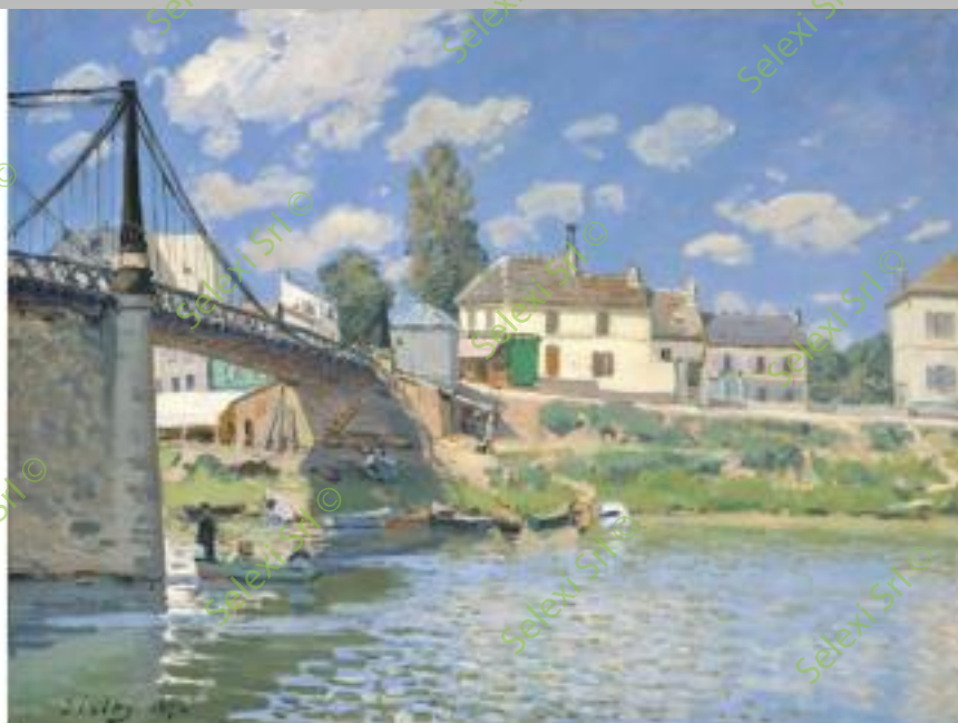
IMMAGINE VS 52