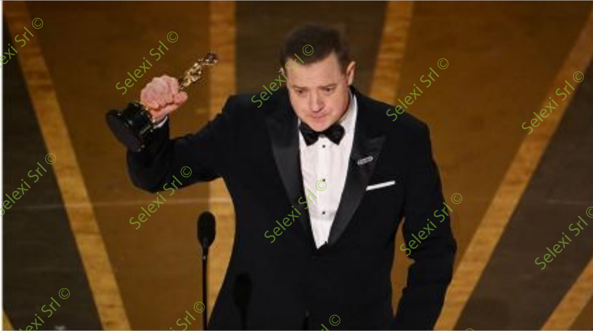
IMMAGINE VS 45