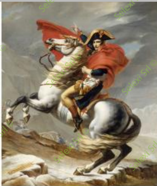
IMMAGINE VS 51