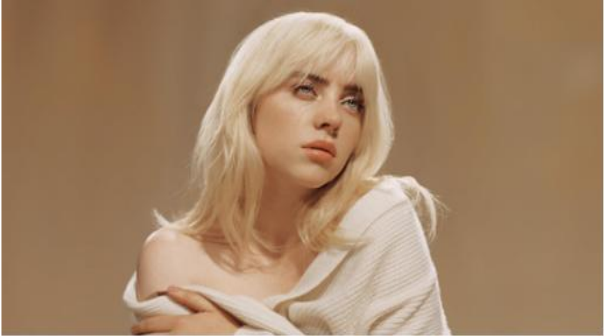
IMMAGINE VP 53