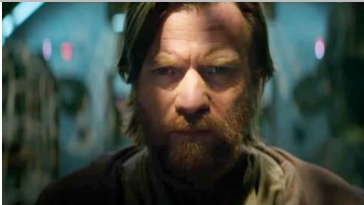
IMMAGINE VP 48

9 Rispondere al seguente quesito facendo riferimento all'IMMAGINE VP 48