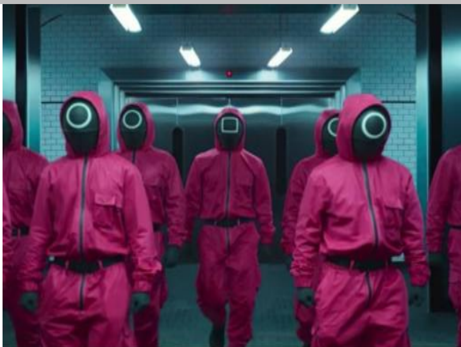
IMMAGINE VP 49

10 Rispondere al seguente quesito facendo riferimento all'IMMAGINE VP 49