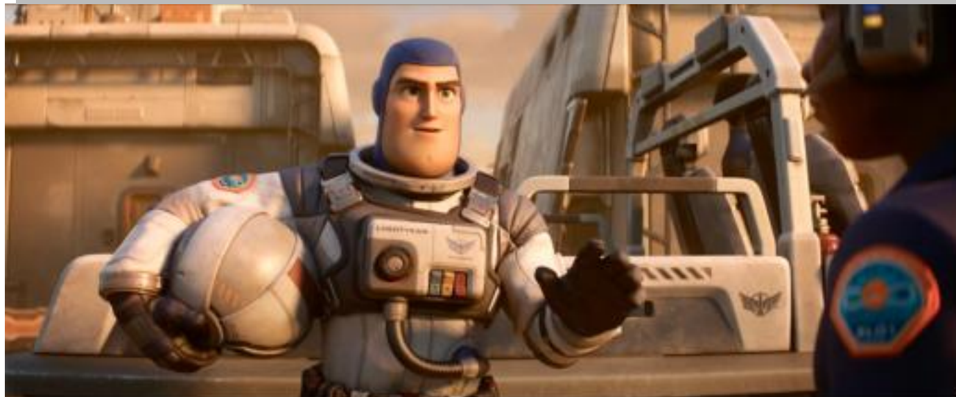
IMMAGINE VP 46