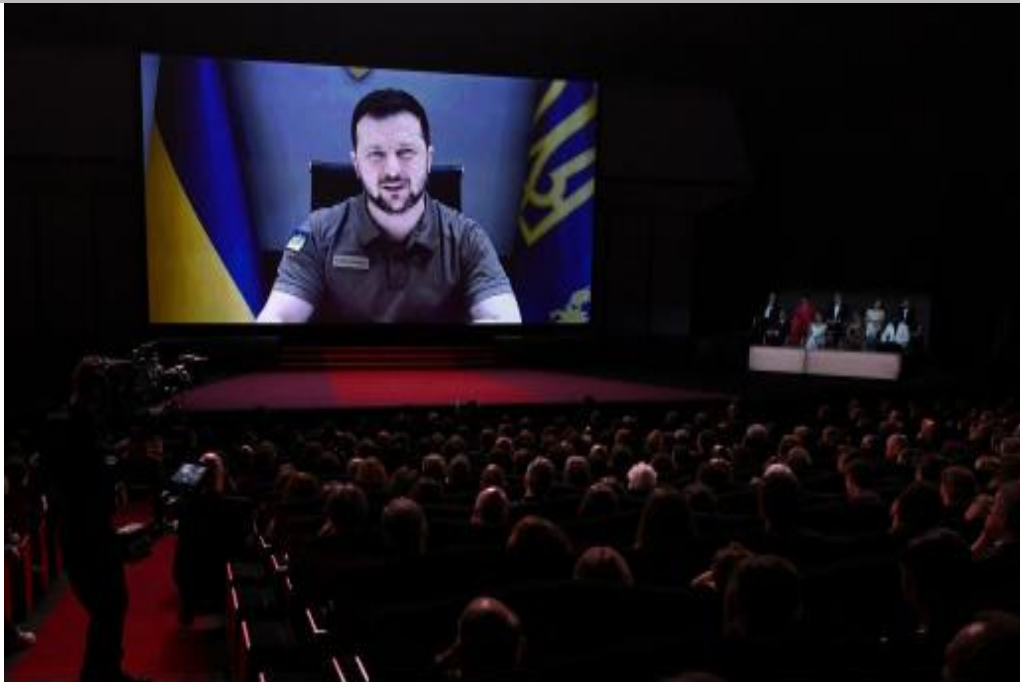
IMMAGINE VP 44