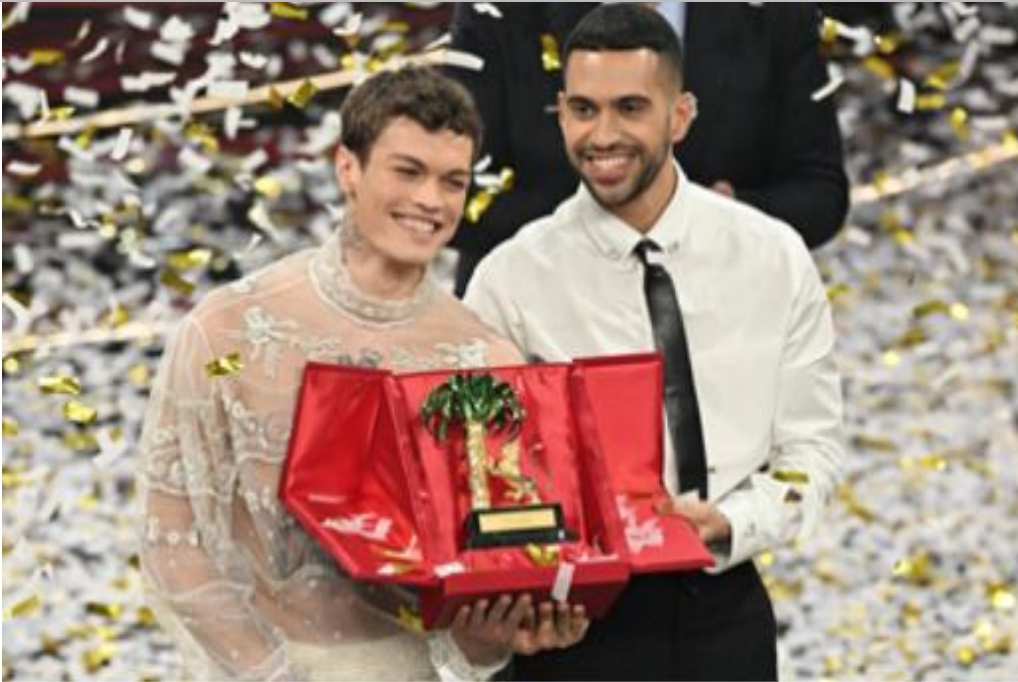
IMMAGINE VP 45