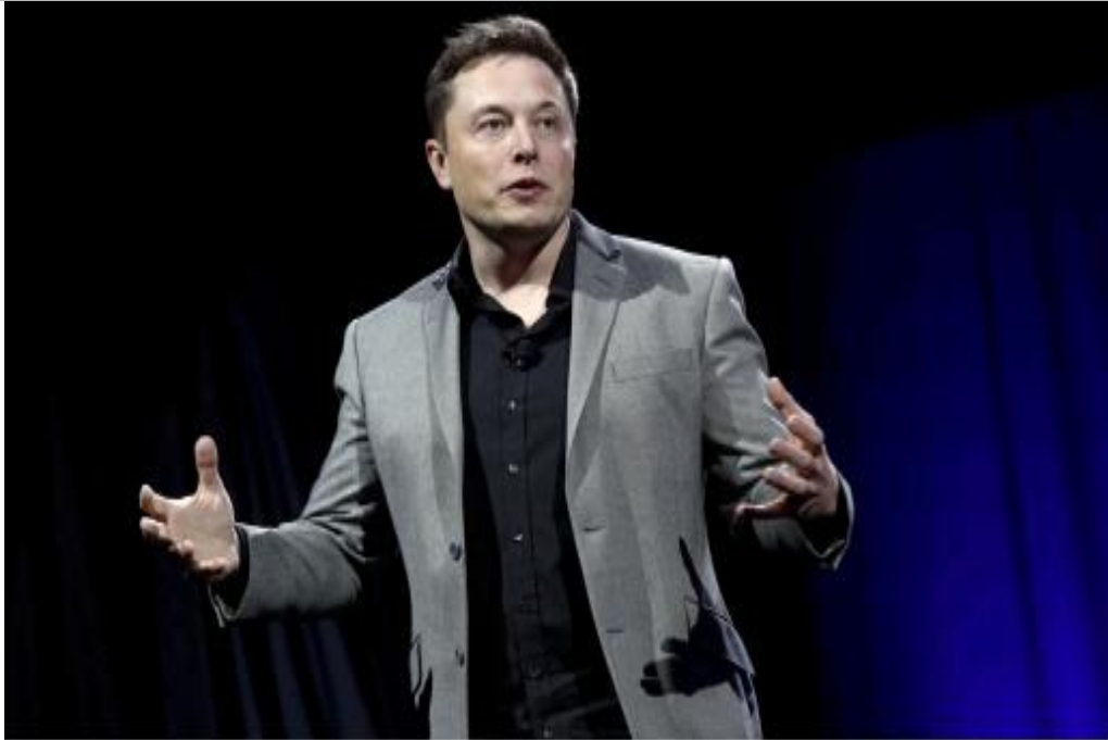
IMMAGINE VP 51